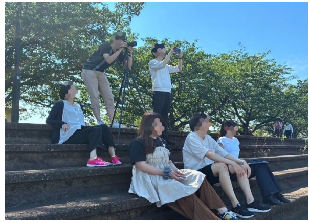
※最上段席イメージ画