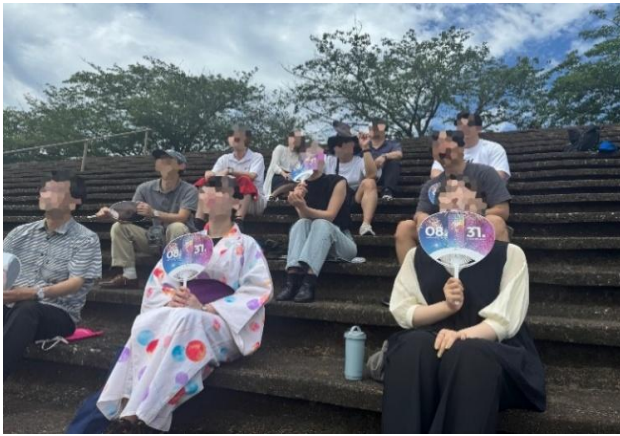
※通常席イメージ画