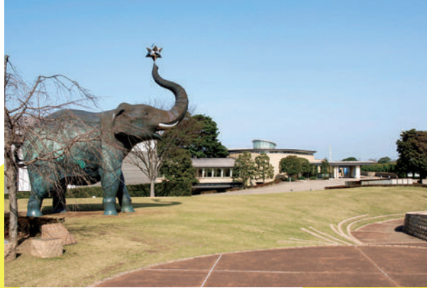
緑豊かな自然とマッチした美術館 大分市美術館

由布岳や高崎山をのぞむ緑に囲まれた丘にある美術館。福田平八郎や高山辰雄、豊後南画の田能村竹田など大分出身の巨匠の作品を所蔵。ユニークな企画展も評判です。