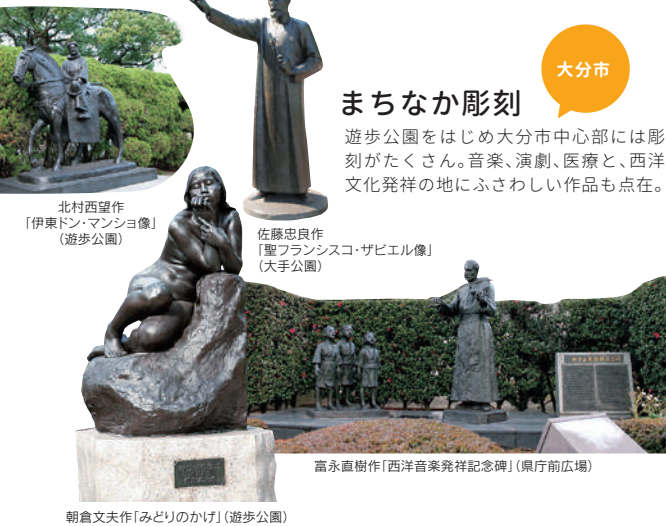
北村西望作「伊東ドン・マンシヨ像」(遊歩公園) 佐藤忠良作「聖フランシスコ・サビエル像」(大手公園) 福永直樹作「西洋音楽発祥記念碑」(県庁前広場) 朝倉文夫作「みどりのかけ」(遊歩公園)

遊歩公園をはじめ大分市中心部には彫刻がたくさん。音楽、演劇、医療と、西洋文化発祥の地にふさわしい作品も点在。