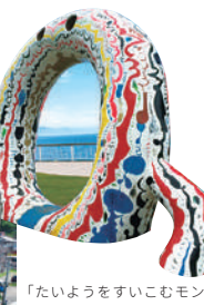
「たいようをすいこむモン」