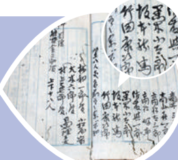
徳応寺に残る「日本人物誌」(大分市佐賀関)