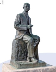
二の丸跡にある朝倉文夫作「瀧廉太郎君像」

所 ▶ 竹田市大字竹田2761 MAP B-5 tel ▶ 0974-63-1541 営 ▶ 9:00～17:00 休 ▶ 年中無休 料 ▶ 300円