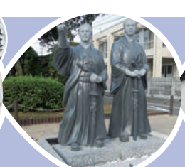
鶴崎の坂本龍馬像(大分市鶴崎)