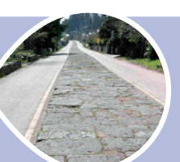
今市の石量(大分市野津原)