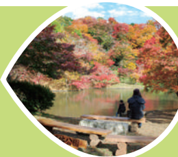
ゆさく 用作公園 (豊後大野市)