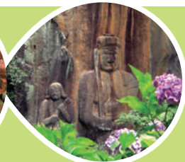
ふこうじ まがいぶつ 普光寺磨崖仏 (豊後大野市)