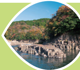
そうかわ ちゅうじょうせつり 十川の柱状節理 (竹田市)