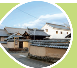
城下町の町並み (竹田市)