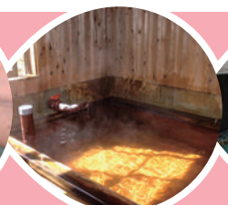
硫酸塩泉 塚原温泉(由布市)