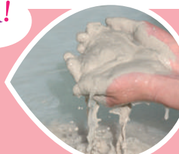
単純温泉 鉍泥温泉(別府市)

ひとことで温泉といっても泉質も効能も様々。大分県には竹田市・長湯の炭酸泉、由布市・塚原の硫酸塩泉など特徴的な温泉も多く、自分好みの温泉をチョイスして楽しめます。