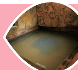
塩化物泉 六ヶ迫鉱泉(臼杵市)