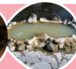
炭酸泉 長湯温泉(竹田市)