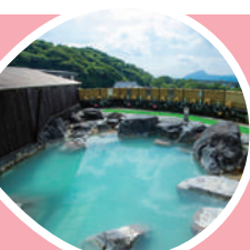
酸性硫化水素泉 明礬温泉(別府市)