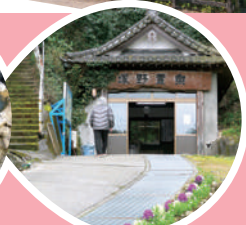
炭酸水素塩泉 塚野鉱泉(大分市)