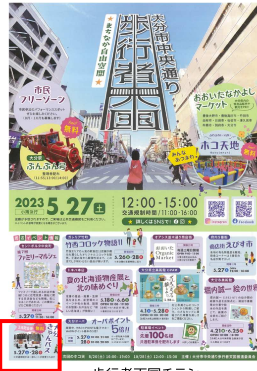
歩行者天国チラシ