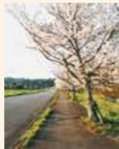
七瀬川沿いの 桜並木