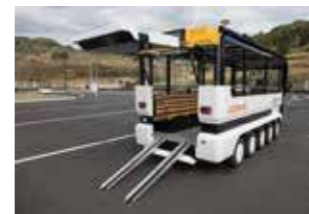
車椅子での乗降も可能