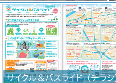
シェアサイクルポート