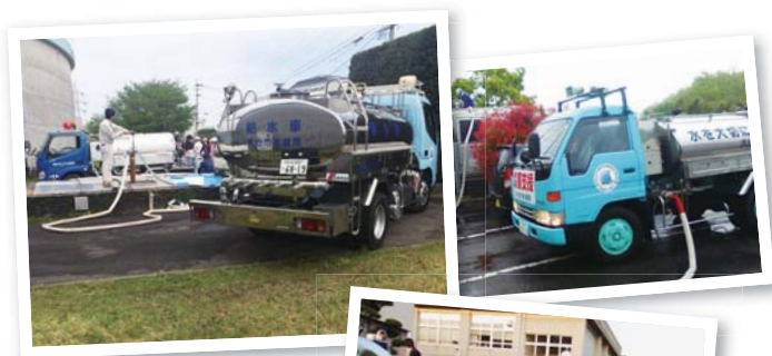
熊本地震 災害応援の様子