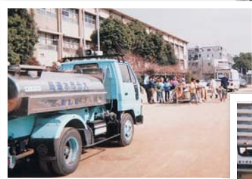
阪神・淡路大震災 災害応援の様子