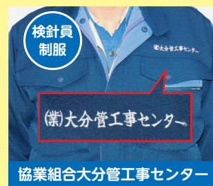
協業組合大分圏工事センター