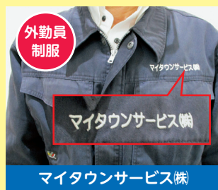
マイタウンサービス(株)