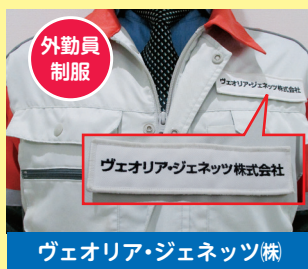
ヴェオリア・ジェネッツ(株)