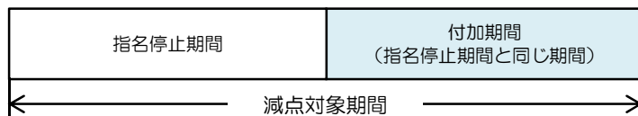
【 指名停止措置による減点の対象事例 】