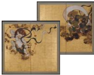
国宝《風神雷神図屏風》