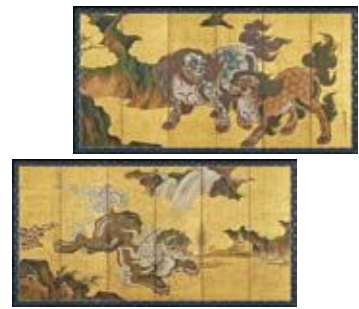
国宝《唐獅子図屏風》