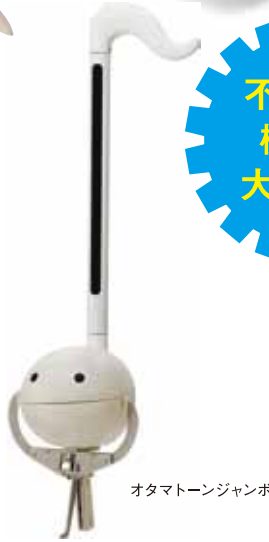
オタマトーンジャンボ