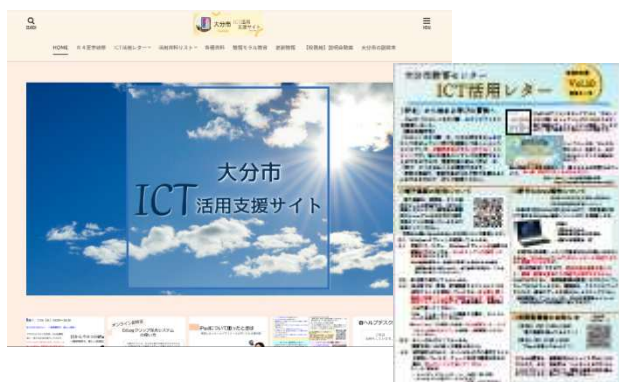
(大分市 ICT 活用支援サイト・ICT 活用レター)

今後の推進の方向性及び課題としては、生成AIなどの先端技術を含めたICTを効果的に活用した授業を推進するため、教員のICT活用指導力の更なる向上に向け、研修等の機会や内容の充実、ICT支援員による支援等を進めていく必要があります。