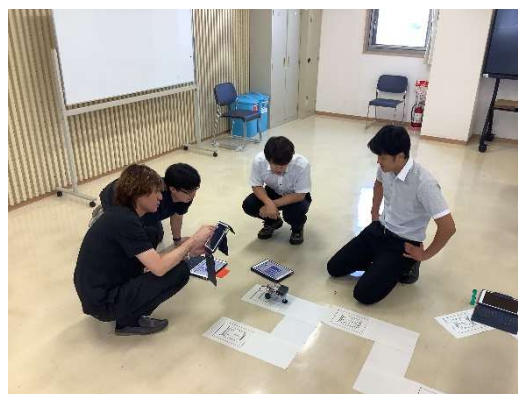
(プログラミング教育研修の様子)