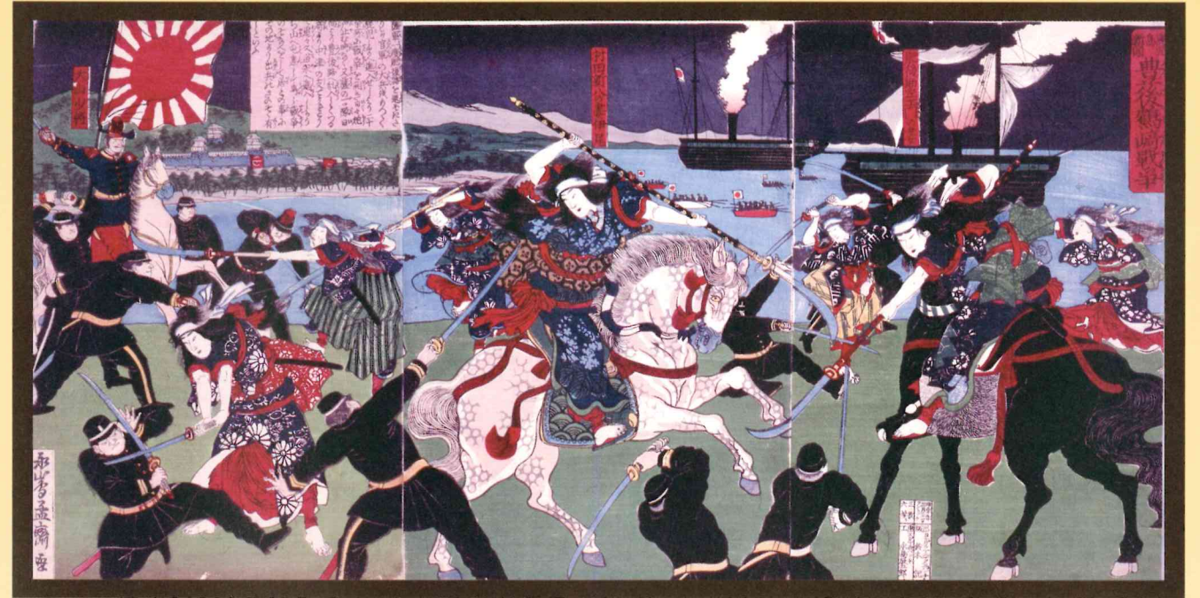
錦絵「豊後鶴崎戦争」 大分市歴史資料館所蔵

永島孟齋が描いた錦絵「豊後鶴崎戦争」は、大分市の鶴崎における明治10年(1877)5月の西南戦争の出来事を題材としたものです。本図は事件の様子を伝えるとともに、薩摩軍を女性に置き換えることで、当時多くの庶民が抱いていた政府への不満を表現していると考えられています。