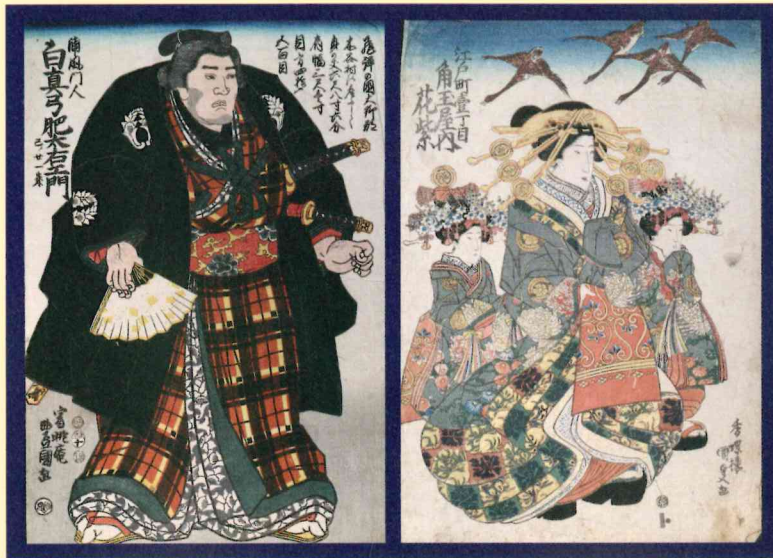
「白真弓肥太右衛門」中根家(大分市)所蔵 「角玉屋内花紫」中根家(大分市)所蔵