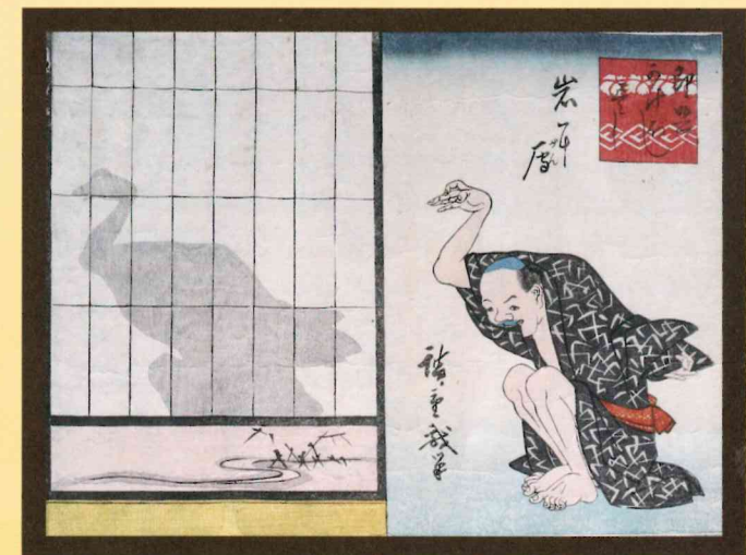
「岩に雁」「即興かげぼし尽くし」 中根家(大分市)所蔵