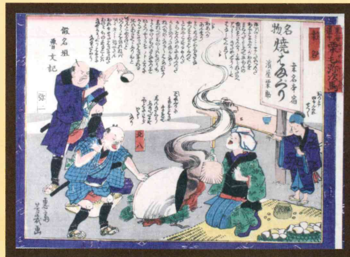
東海道中栗毛弥次馬・桑名 大分市歴史資料館所蔵

本図には桑野名物の焼貽を食べようとして、逆に貝に手を挟まれる滑稽な場面を軽妙に描き出しています。