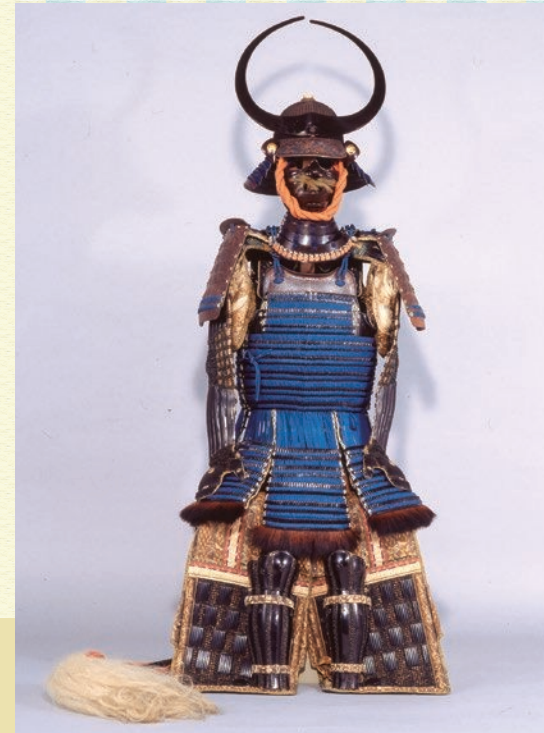
「青糸威二枚胴具足」松原神社(大分市)所蔵