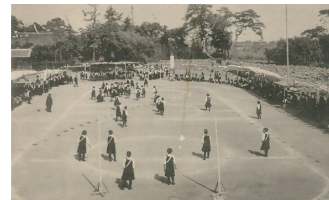
「アソシエーション・フットボール」(大正5年)