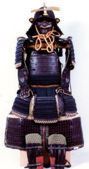
「岡本家青糸威二枚胴具足」 大分市歴史資料館所蔵