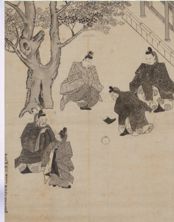
「土佐長隆/中大兄蹴鞠図」東京国立博物館所蔵 ColBase( https://colbase.nich.go.jp/collection_items/tmm/A-1640?locale=ja )を加工