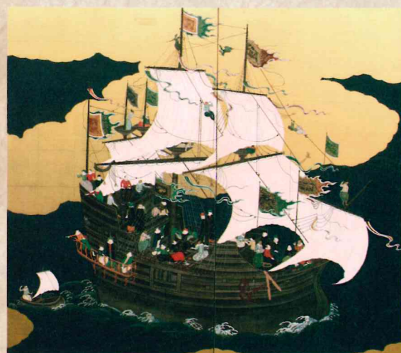
南蛮船 「南蛮屏風」左隻（部分）