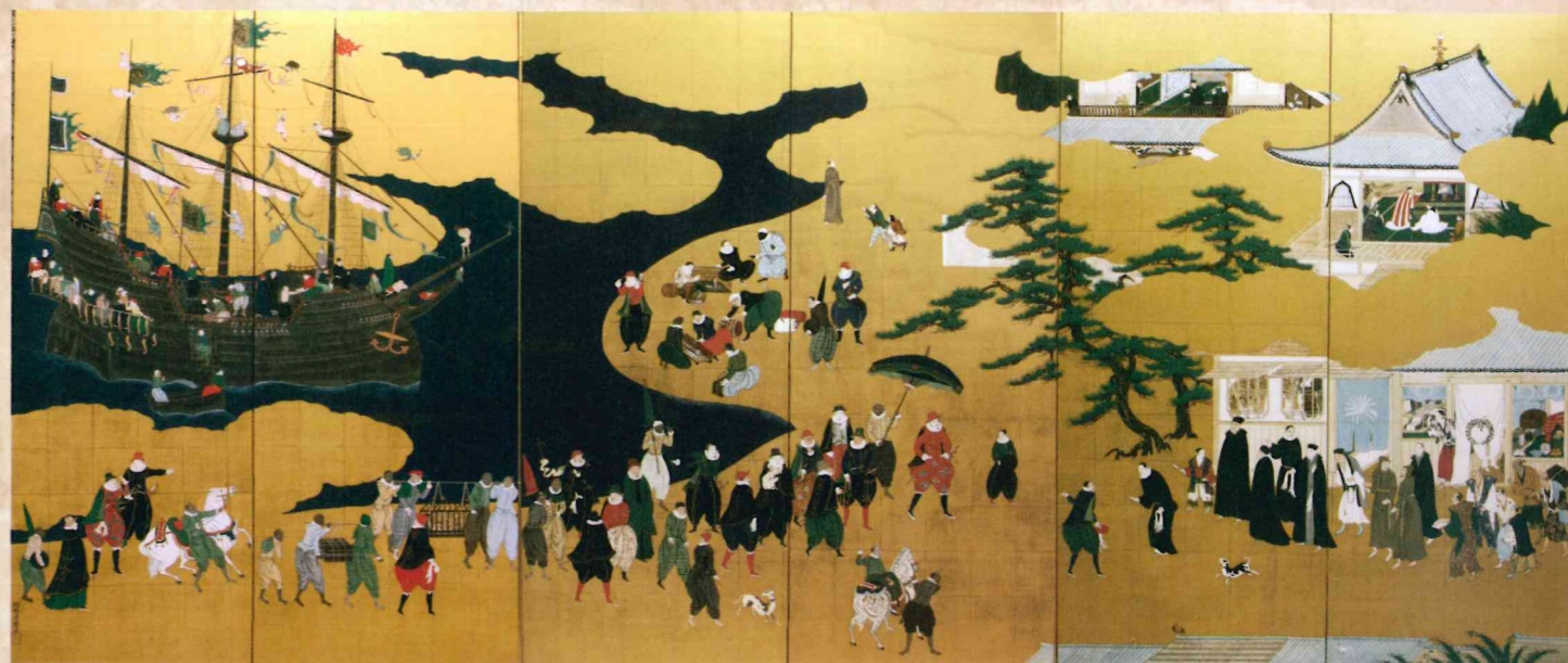
「南蛮屏風」右隻【模写】 原本：神戸市立博物館蔵