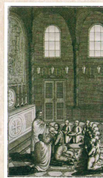
「宗麟の洗礼の図」 同左