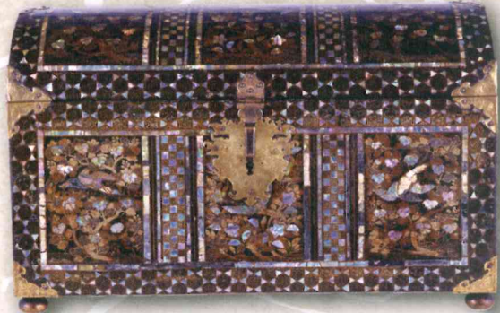
花鳥文時絵螺鈿洋櫃