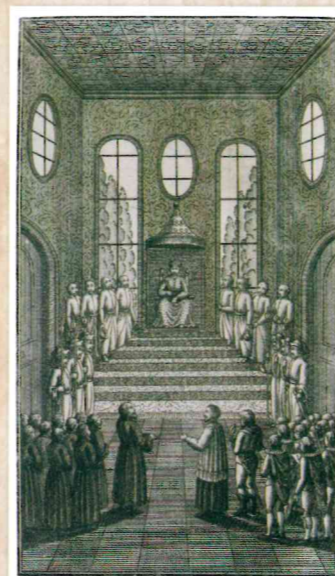
「ザビエルと日本の僧侶の図」 『イエズス会士日本書簡集』（ドイツ語版）

『イエズス会士日本書簡集』（ドイツ語版全3巻 1795年～98年まで刊行）は、宣教師の報告をまとめたもので、府内でのザビエルの活動や大友宗麟の洗礼の様子が記されています。