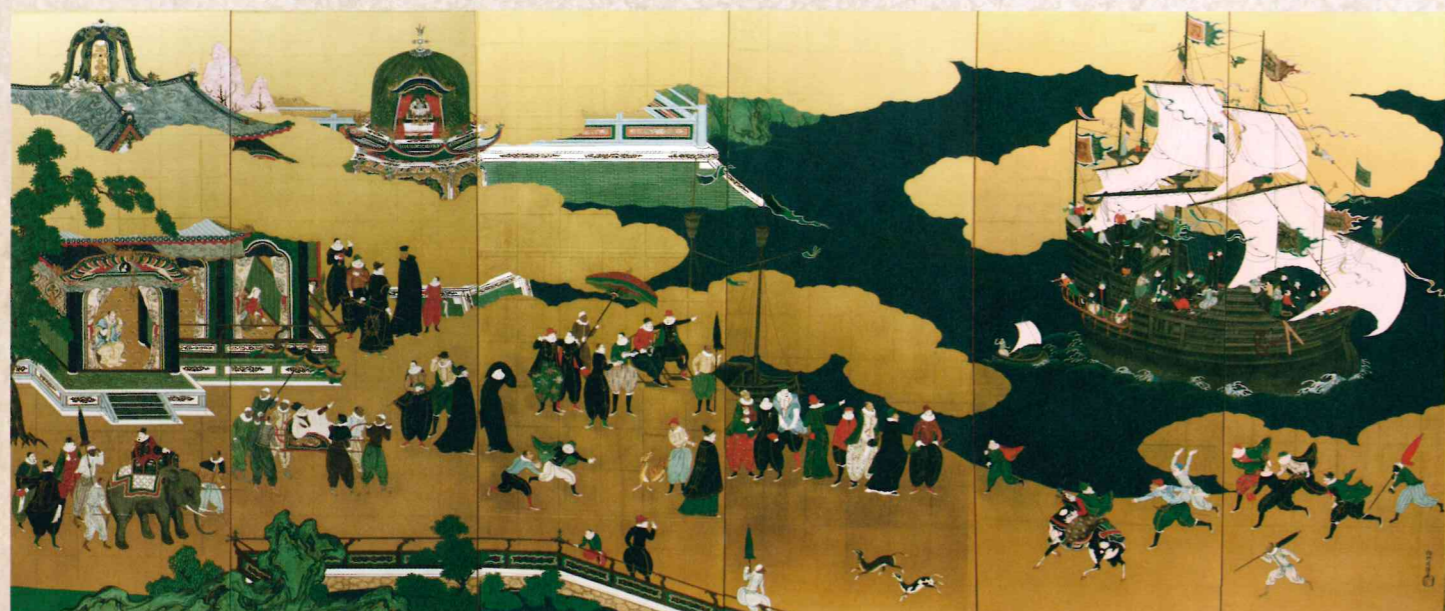
「南蛮屏風」左隻【模写】 原本：神戸市立博物館蔵

また、トラやゾウなどの珍しい動物が南蛮から豊後に持ち込まれたことも、記録に残されています。