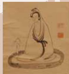
観音画 隠元・即非筆 西光寺(大分市)所蔵 万松寺(別府市)保管