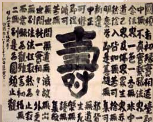
寿字円頓章 白隠筆 萬壽寺(大分市)所蔵