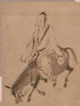
杜子美図 伝牧谿画 松永コレクション 福岡市美術館所蔵