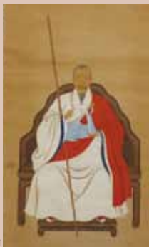
県指定有形文化財 紙本着色隠元・木庵・即非三幅対象(隠元像) 長福寺(大分市)所蔵