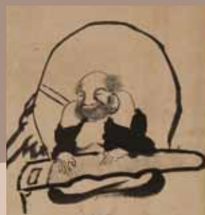
布袋図 春叢筆 大分市美術館所蔵