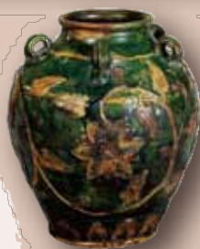
華雨二彩壺 華道家元池坊総務所所蔵