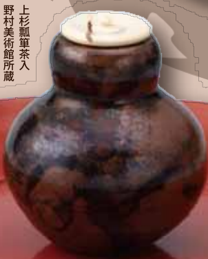
上杉瓢箪茶入 野村美術館所蔵