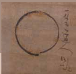
円相図 仙厓義梵筆 三宅コレクション 福岡市美術館所蔵