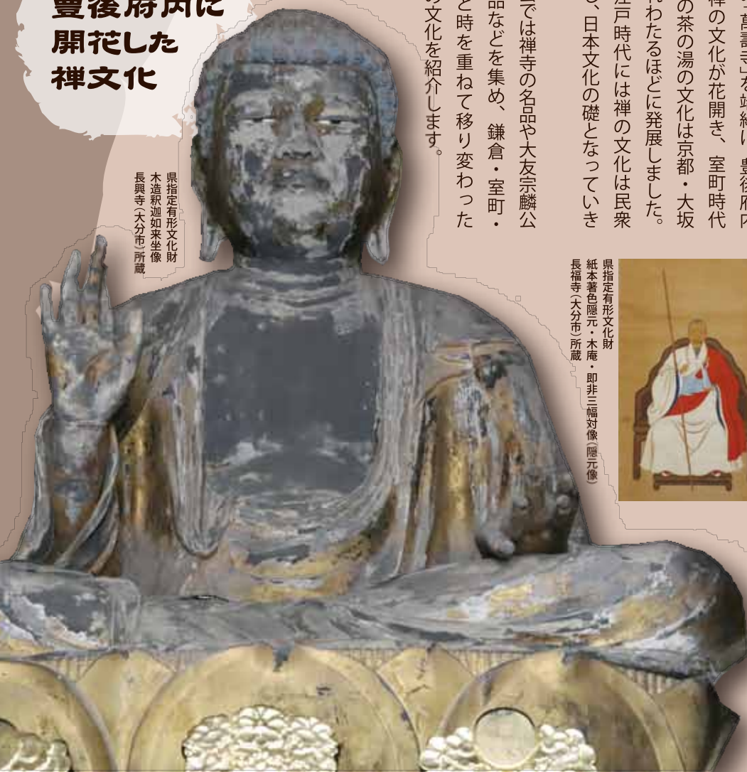
県指定有形文化財 木造釈迦如来坐像 長興寺(大分市)所蔵