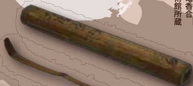
茶杓 伝古田織部作 早吸日女神社社家 小野家 (大分市)所蔵