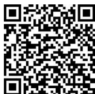
【中学校・碩田学園】