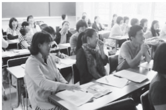
家庭教育学級リーダー研修会