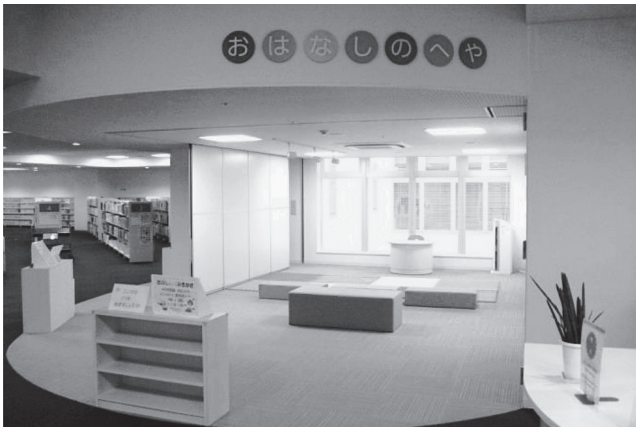
市民図書館2階おはなしのへや

本館所在地 大分市金池南1丁目5番1号 電話 097-576-8241 FAX 097-544-5615 分館所在地 大分市府内町1丁目5番38号 電話 097-538-3500 FAX 097-538-3744