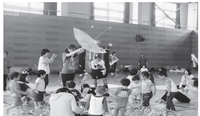
乳幼児家庭教育学級

子育て支援に関する学習を通じて、地域で活躍する子育て支援者のスキルアップを図る。