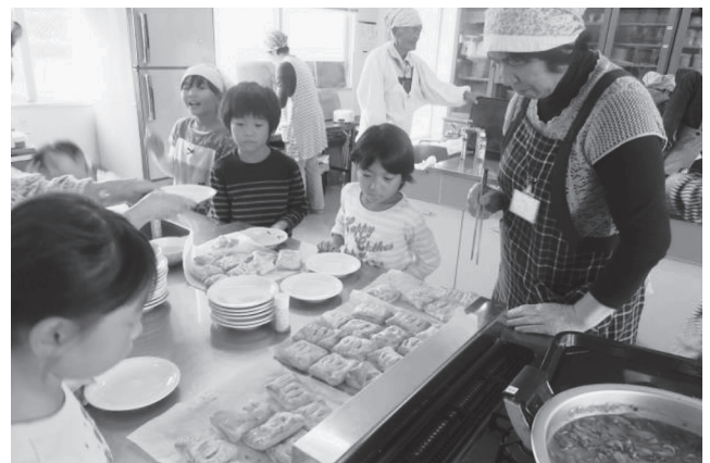
おおいたふれあい学びの広場推進事業