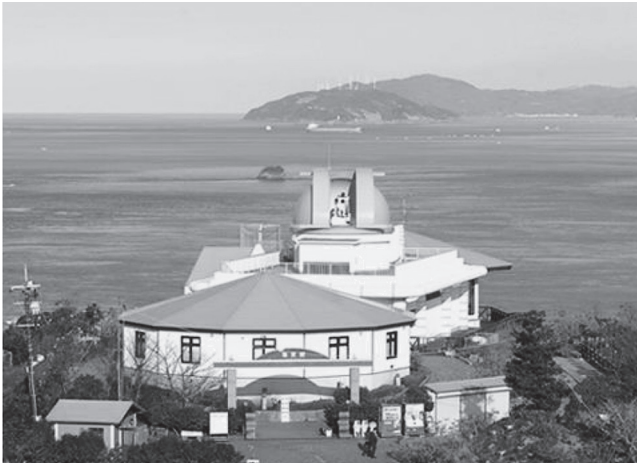
関崎海星館から豊後水道を望む

所在地 大分市大字佐賀関4057-419 電話 097-574-0100 FAX 097-574-0555 URL http://www.kaiseikan.jp E-mail star@kaiseikan.jp