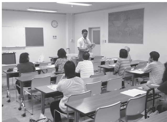
おおいたナイトスクール