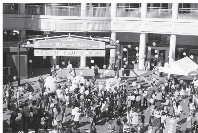
おおいた人権フェスティバル2015

内容としては、「人権作文、人権標語、人権ポスター」を募集し、優秀作品は、「人権作品集」としてまとめる。