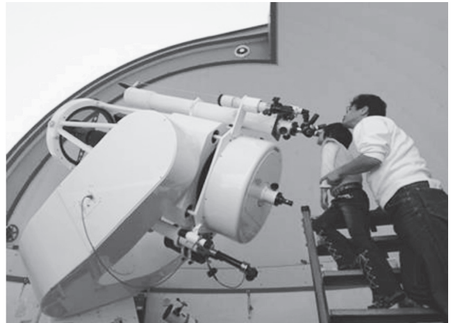
60cmニュートン・カセグレン式反射望遠鏡 (望遠鏡で天体観察をする親子)