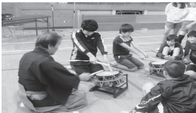
伝統芸能ふれあい教室