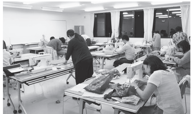
服飾ソーイングコース