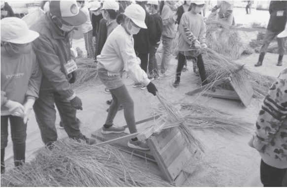
農業の体験活動（総合的な学習の時間）