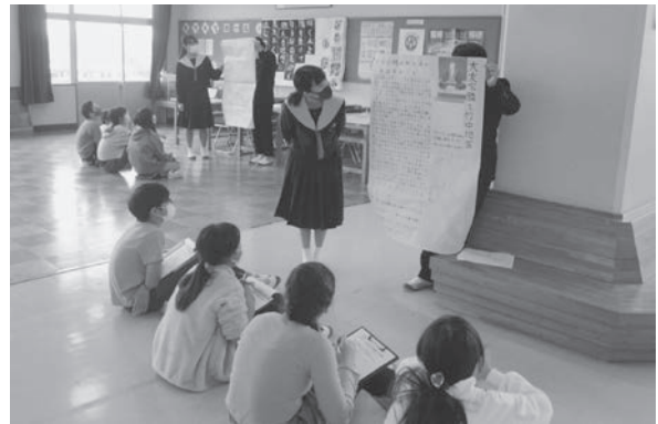
小中一貫キャリア教育発表会