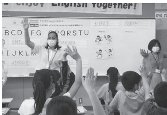
授業でのチーム・ティーチングの様子

児童生徒が外国の文化や言語に触れ、それらに対する興味・関心を高めるとともに、コミュニケーションを図る資質・能力を育成をするため、各小中学校及び義務教育学校に外国語指導助手を派遣し、外国語活動や英語の授業等において活用する。