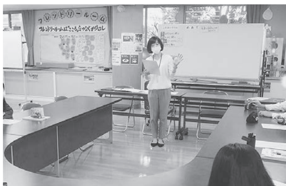
教育支援教室「フレンドリールーム」 (大分市教育センター)