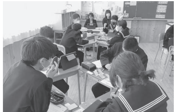
グループでの話し合い活動（社会科）