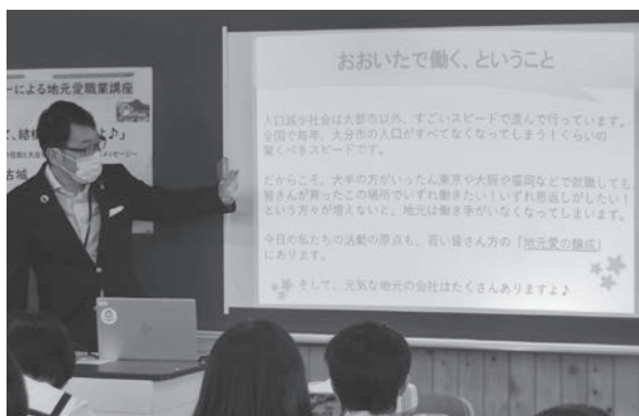
企業リーダーによる地元愛職業講座