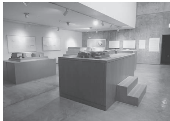
磯崎新建築展示室

展示室は、面積12㎡から111㎡の9つの部屋に分かれており、主要建築模型は60'sホールの一部も使用し展示している。