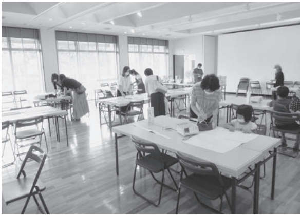
ワークショップを行うボランティア

美術関係資料の収集整理、所蔵作品の解説、ワークショップの実施、その他展覧会諸事業への協力など。