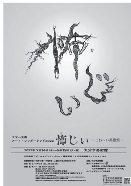
アート・ワンダーランド2022 お怖い —こわ〜い美術館—