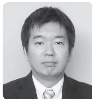
生 野 委 員