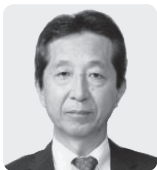
三 浦 教育長

教育長および教育委員は教育委員会会議における審議、市長との協議調整の場である「大分市総合教育会議」における協議、学校訪問、施設の視察などを行う中で、本市教育の振興に努めている。