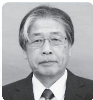
古 城 委 員