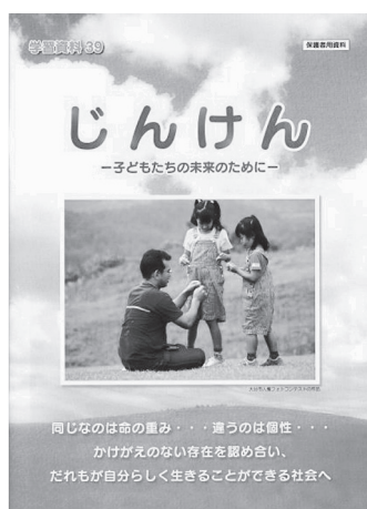
学習資料「じんけん」