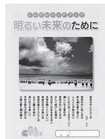
じんけんハンドブック