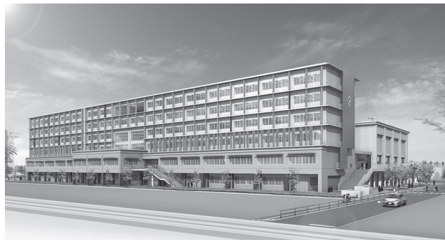
碩田学園校舎完成予想図 (平成29年2月末完成予定)