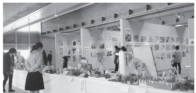
「朝倉文夫賞」彫塑展