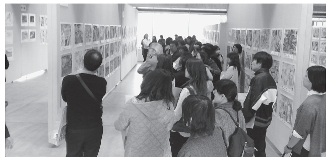
「福田平八郎賞」図画展