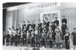
竹中中学校区の合同文化祭での合唱のようす