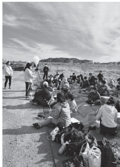
体験・楽習・すこやか講座

地区公民館エリアの各種団体と連携・協力して子どもの体験活動の充実を目指すとともに、地域ぐるみの青少年の健全育成の推進を図り、新たな地域づくりを進める。