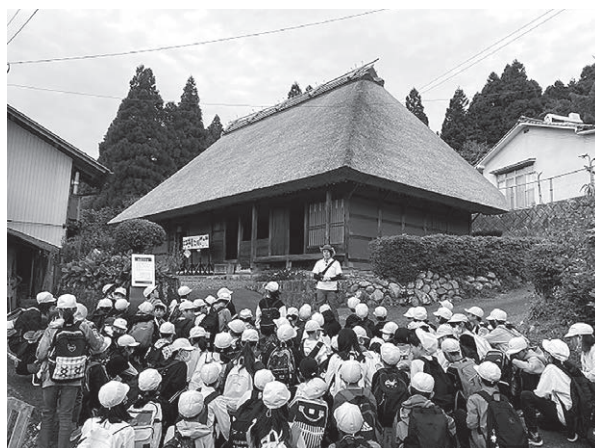
探検ウォーク～後藤家住宅見学～