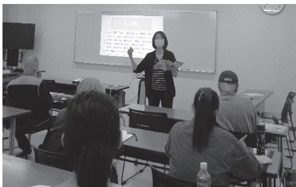
おおいたナイトスクール