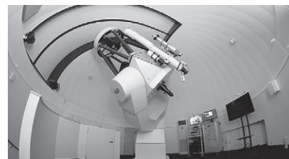
大分県内最大口径 83cmの天体望遠鏡