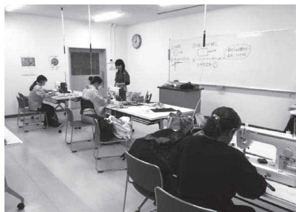
はじめてのソーイング（実用コース）