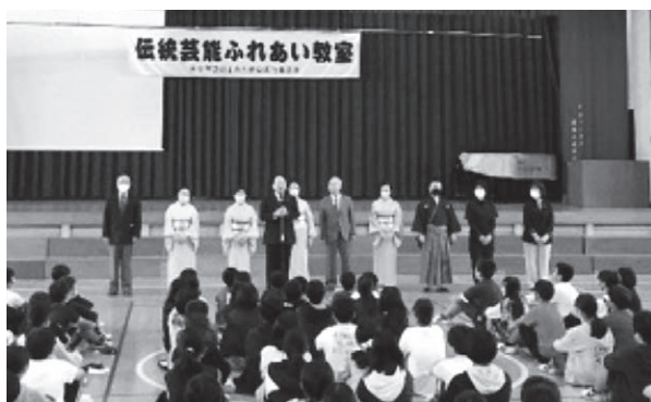
淡窓伝光霊流大分詩道会