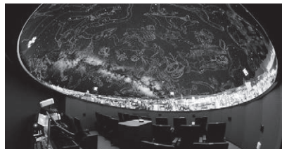
新設したデジタル式プラネタリウム

施設周辺は豊かな自然に囲まれ、展望室からは、東は四国佐田岬、北は国東半島や姫島まで、視界300度のパノラマが堪能できる。