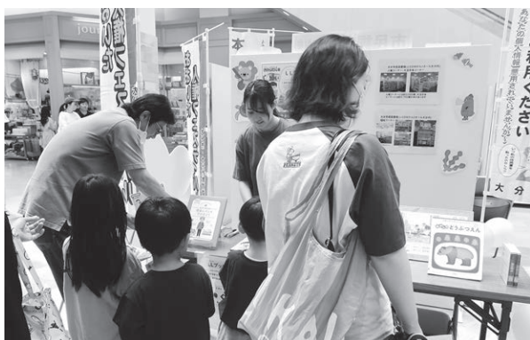
おおいた人権フェスティバル 2024

内容としては、「人権作文、人権標語、人権ポスター」を募集し、優秀作品は、「人権作品集」としてまとめる。