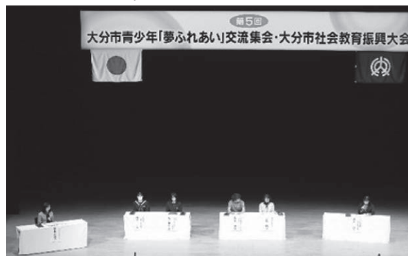
大分市青少年「夢ふれあい」交流集会・大分市社会教育振興大会