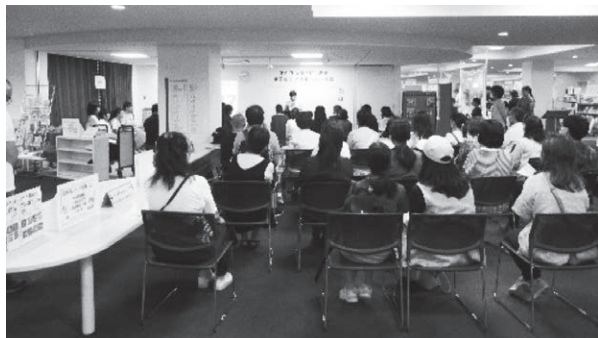
中学生ビブリオバトル

分館所在地 大分市府内町1丁目5番38号 (コンパルホール内) 電 話 097-538-3500 FAX 097-538-3744