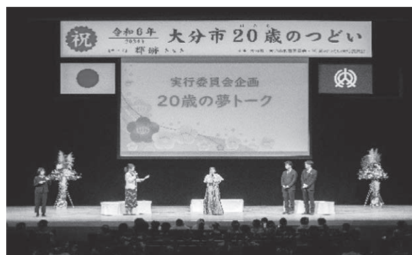
令和6年大分市20歳（はたち）のつどい