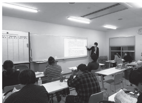
社労士受験対策コース（資格取得コース）

現代社会における青少年等の本校学生の現状を理解し、実際社会に必要な職業的専門知識や技能の習得、並びにコミュニケーション能力を高め、社会的自立可能な青少年等を育成する。