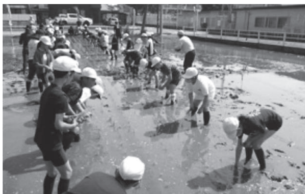
地域学校協働活動の様子