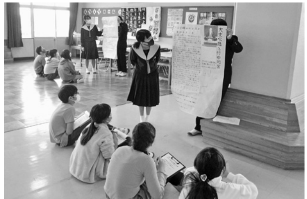
小中一貫キャリア教育発表会