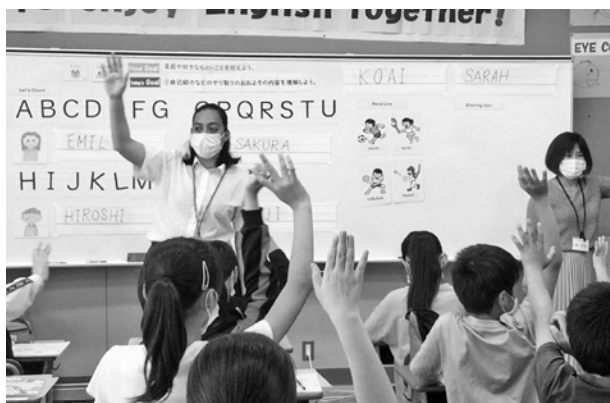
授業でのチーム・ティーチングの様子

児童生徒が外国の文化や言語に触れ、それらに対する興味・関心、外国語学習に対する意欲を高めるとともに、コミュニケーション能力の育成を図るため、各小中学校及び義務教育学校に外国語指導助手を派遣し、外国語活動や英語科の授業等において活用する。