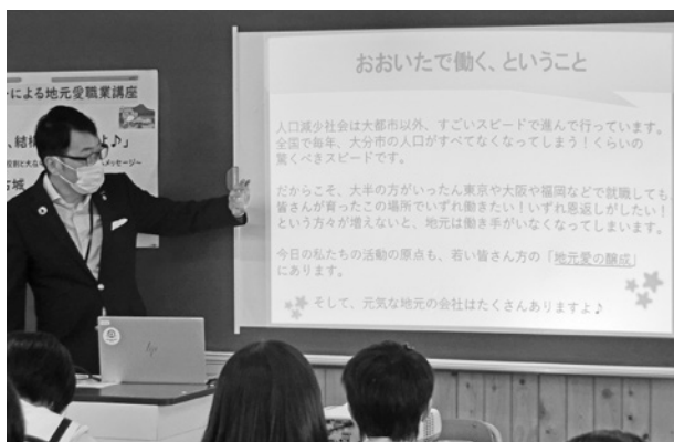
企業リーダーによる地元愛職業講座