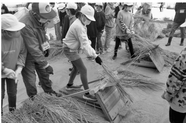
農業の体験活動（総合的な学習の時間）