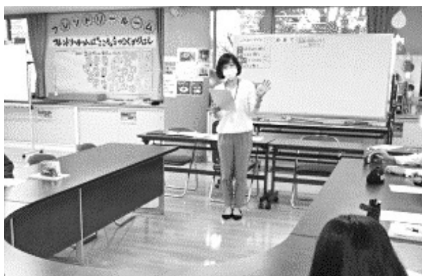
教育支援教室「フレンドリールーム」 (大分市教育センター)