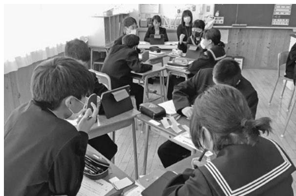
グループでの話し合い活動（社会科）