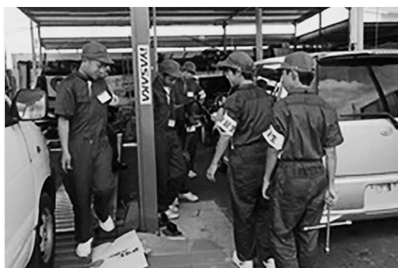
自動車整備工場での職場体験学習