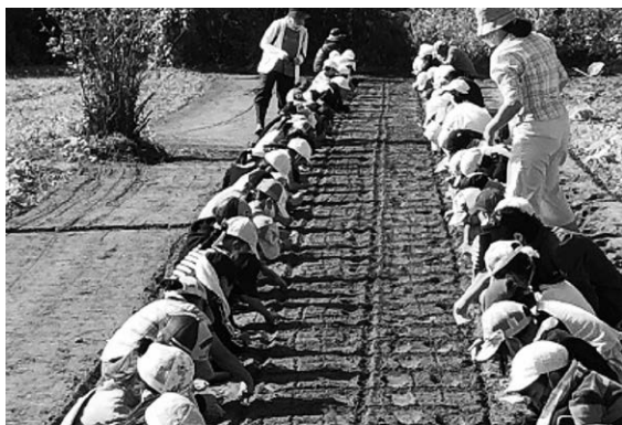
農業の体験活動（生活科）