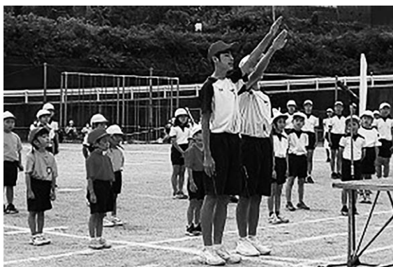
地域合同の体育大会