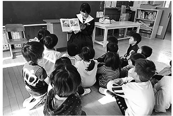
中学生による読み聞かせ