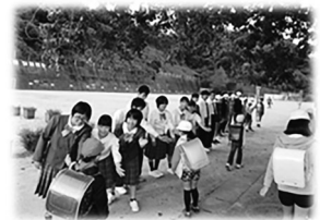
原川中学校区 里帰りあいさつ運動の様子