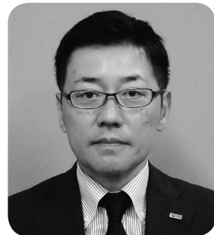
古城 一 委員