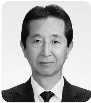
三浦 享二 教育長

教育長及び教育委員は教育委員会会議における審議、市長との協議調整の場である「大分市総合教育会議」における協議、学校訪問、施設の視察などを行う中で、本市教育の振興に努めている。