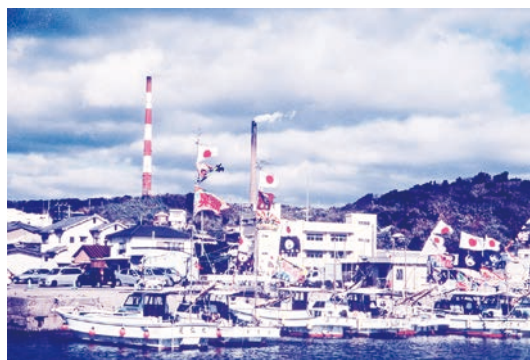
佐賀関ににぎわいを再び

本市は、被災者が主体的に行う生活再建を積極的に支援する方針である。市民サポートセンター、被災者支援チームによる被災者への支援や保健師などの被災者への丁寧な聞き取りによる心のケアなど、既に支援体制を構築しており、公民連携の下、アウトリーチで対応していく。また、復興計画については、「生活自立再建の推進」「災害に強いまち」「住み続けられるまち」の3つの視点に基づき、被災地区住民の意向を尊重した復興計画の早期策定に取り組む。