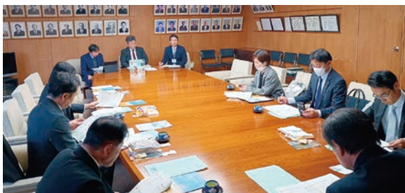
たかまつ市議会レポートについて (高松市) (2月16日~18日 視察地: 高松市、豊岡市)