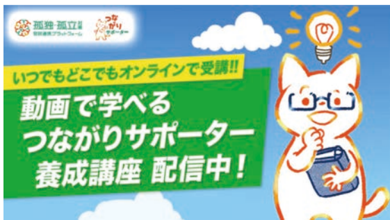
内閣府が作成した つながりサポーター養成動画