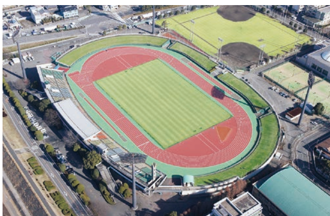
今後の在り方を検討している津留運動公園