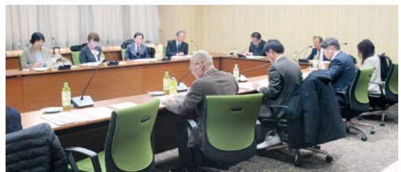
長岡京市助け合いとつながりのまちづくり条例について (長岡京市) (1月19日~21日 視察地: 長岡京市、春日井市)