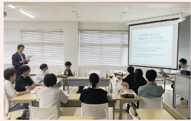
議員による意見交換前の事前説明の様子 (日本文理大学)