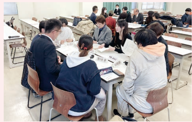
学生と議員との意見交換の様子 (大分大学)