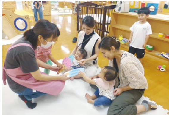
子育て支援策を必要な世帯へ

第3期すくすく大分っ子プランにおいて、妊娠・出産・育児の切れ目のない支援等の目標を掲げ、107の具体的な施策を推進している。子ども・子育て会議や市民意識調査等で効果を検証し、相談支援体制の充実とともに、子育て支援サイトnanaや電子母子手帳アプリ等を通じ、積極的な情報発信に努める。