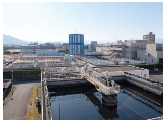
将来を見据えた水道施設整備を (古国府浄水場)

国の上下水道政策の基本的なあり方検討会では、中山間地や過疎地等における小規模な水道施設の整備や運搬送水、各戸型浄水装置の設置等について取組の方向性が示されている。今後、新たな施設の整備や更新に当たっては、維持管理を含めた費用や水質、耐災害性を総合的に比較検討した上で行っていく。