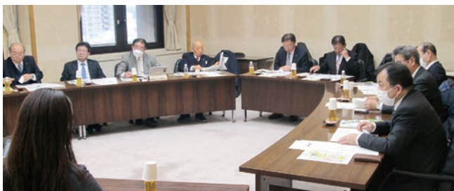
議会改革について（横須賀市） 〈1月14日～16日 視察地：安城市、横須賀市〉