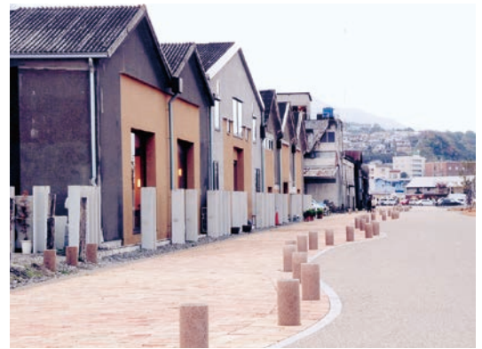
かんたん港園の倉庫街

当地区の官民連携による魅力創出については、映画ロケ地としての魅力をPRするなど情報発信を強化するとともに、民間団体等との連携を深め、観光スポットとしての魅力向上に取り組んでいく。