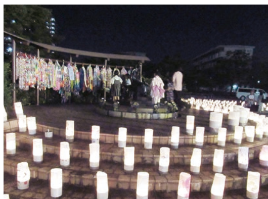
非核三原則の堅持を (ムッチャン平和祭の様子)

非核三原則は、核兵器のない平和な社会の実現を目指す重要な理念であると認識している。本市としては、平和都市宣言の理念の下、市民の平和意識の醸成や平和行政の推進など、自治体として果たすべき役割に引き続き取り組んでいく。