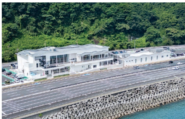
県内自治体と連携した観光振興を(道の駅たのうらら)