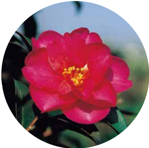
大分市の花「サザンカ」