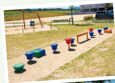
カラフルなステップもあります♪