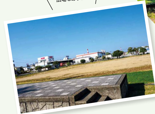
公園をぐるっと囲むように ジョギングコースが整備 されているので、運動不足が 気になる人はぜひ

三佐小学校の西側にある“ワクワク”が詰まった公園。芝生エリアにはカラフルな遊具がズラリと並び、特にすべり台やぶらさがりロープなどが一体となった大型のコンビネーション遊具が人気！広場エリアではサッカーや野球などのスポーツを思い切り楽しむことができます。