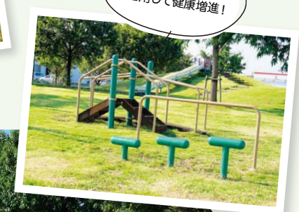
5種類の健康器具を 活用して健康増進！