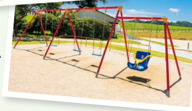
背もたれとシートが付いた安全なブランコも!