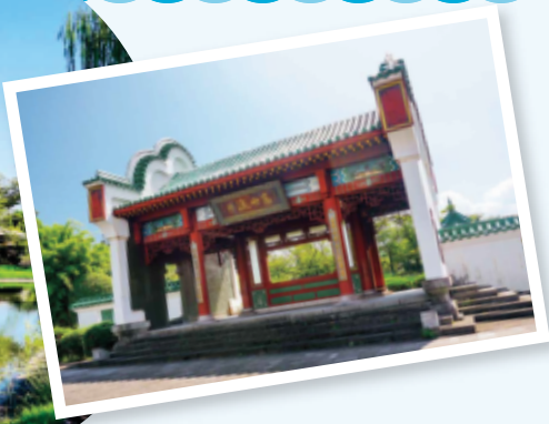
異国情緒あふれる 国際交流広場