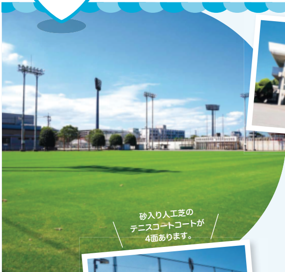
砂入り人工芝の テニスコートが 4面あります。