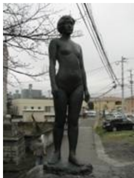
No. 39 作品名 立っている女 制作者 宮原 正行 設置場所 県道大分臼杵線 猪野交差点緑地

とどめることのできぬ若さのもつ美しさは 蜃気楼のような存在にも思える。 その存在を彫刻の存在感に重ねている