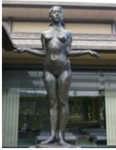
No. 43 作品名 開 制作者 辻畑 隆子 設置場所 平和市民公園能楽堂

均整のとれた肢体の裸婦像が後ろ腰に布を当て、両端を左右に引っ張りながら立っているポーズで、無心、平凡のなかの強さを表現した作品