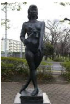
No. 32 作品名 蜃気楼(しんきろう) 制作者 原田 裕明 設置場所 平和市民公園国際交流広場

とどめることのできぬ若さのもつ美しさは 蜃気楼のような存在にも思える。 その存在を彫刻の存在感に重ねている