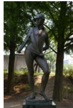
No. 31 作品名 立ちどまる風 制作者 辻畑 隆子 設置場所 平和市民公園芝生広場