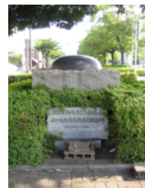
No. 20 作品名 鶴崎踊り記念碑 制作者 常木 新二 設置場所 鶴崎駅前広場