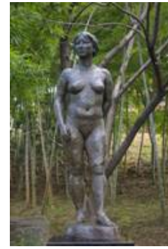
No. 45 作品名 女(ひと) 制作者 国清 大介 設置場所 平和市民公園和風庭園