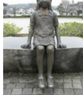
No. 48 作品名 遥 HARUKA 制作者 佐脇 健一 設置場所 北下郡児童公園 公園を訪れた人々と一緒に腰掛けたり、鑑賞者と同じ高さで、じかに触れ合い、親しんでもらうことを意図した作品