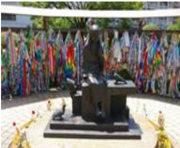
No. 28 作品名 ムッチャン平和像 制作者 村上 炳人 設置場所 平和市民公園ワンパク広場

昭和52年に毎日新聞大阪本社が 企画した戦争体験記に疎開先の 大分市で出合った少女「ムッチャン」 の思い出の手記を投稿し、それが 記事として掲載され建立に至った