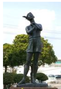
No. 40 作品名 乙女 制作者 三浦 紀代 設置場所 高城駅前ロータリー