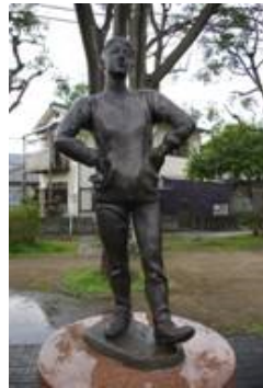
No. 44 作品名 踏歌(とうか) 制作者 岩尾 順 設置場所 平和市民公園 国際交流広場

均整のとれた肢体の裸婦像が後ろ腰に布を当て、両端を左右に引っ張りながら立っているポーズで、無心、平凡のなかの強さを表現した作品