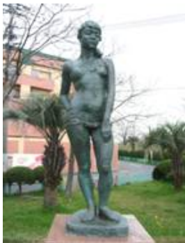
No. 46 作品名 時-木陰 制作者 溝口 晴美 設置場所 大分ホーバー基地跡地 南国の森