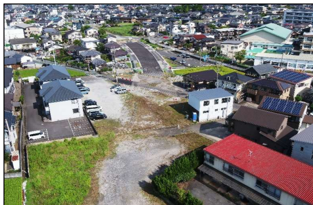
工事前（令和7年度平面区間）