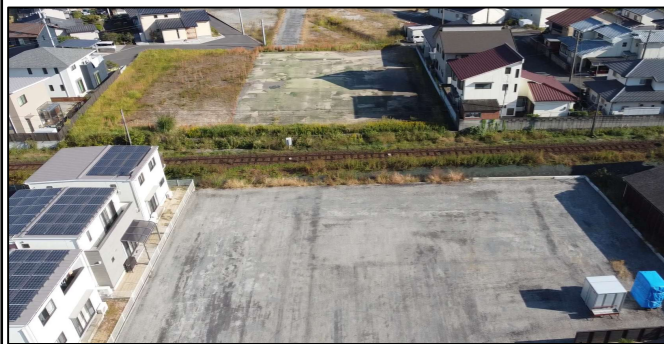
工事前（JR豊肥本線直下部工事箇所）