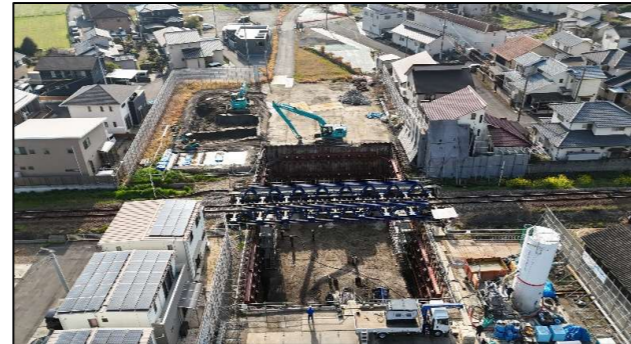
令和7年度末施工中（JR豊肥本線直下部工事箇所）