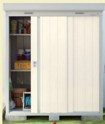
メーカー指定のコンクリートブロック基礎 + アンカー固定