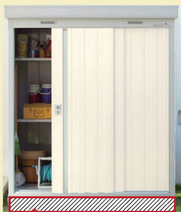
ベタ基礎（鉄筋入り）+ アンカー固定 布基礎（鉄筋入り）も OK