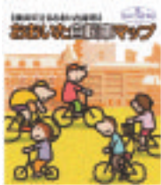
都市交通対策課、1階案内所にてお渡ししています。

途中の道沿いには、自治会の皆さんが種から育てたパンジーやキンセンカなどの花を見ることができ、そのかわいらしさに心が和みます。少し坂を