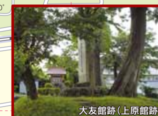
大友館跡(上原館跡)