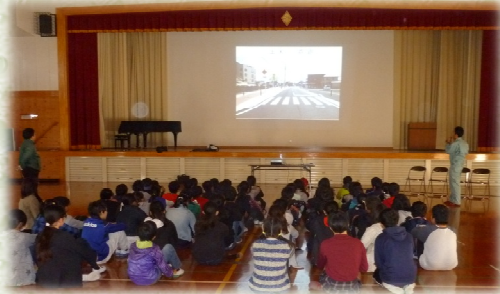
教室風景♪ 体育館で行ないました♪

大分市立 明野東小学校5年生57人、6年生62人の児童へ、都市計画やまちづくりについての出前教室を行ないました。