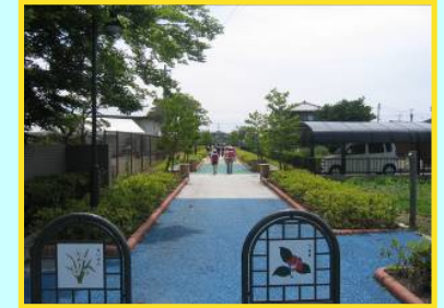
歩行者専用道路1号線