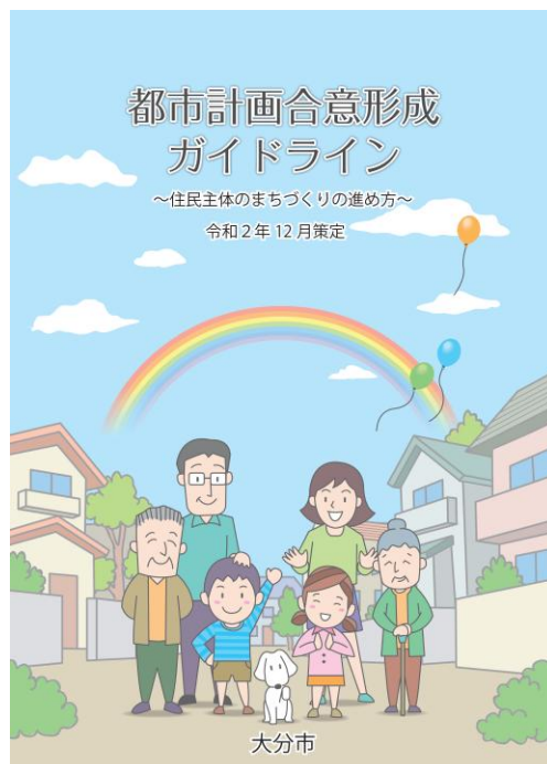
都市計画合意形成ガイドライン【大分市】

なお、地域の皆様が主役になって考え、住みよいまちを協力しながらつくり・守るまちづくりを進めるにあたり、その具体的な進め方や話し合いを進めていく上でのポイントなどをまとめた「都市計画合意形成ガイドライン」も作成しておりますので、本手引きとあわせてご参照ください。