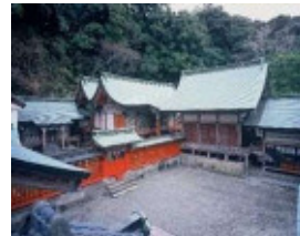
【大分市】柞原八幡宮