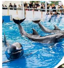
▲イルカショーの様子