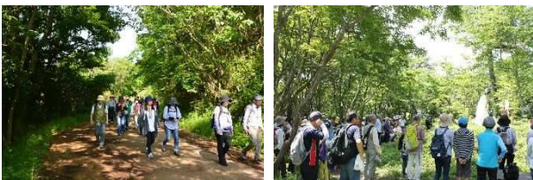
▲H29 年 5 月 高崎山セラピーロード山開き