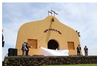
▲人工島にある恋人の聖地