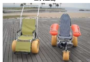
▲NPO 法人による海用の車椅子の貸出し