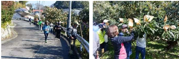
▲H29 年 3 月 森林セラピー&田ノ浦びわ袋がけ体験 in 高崎山