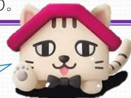
空き家対策ナビゲーター あきにゃん