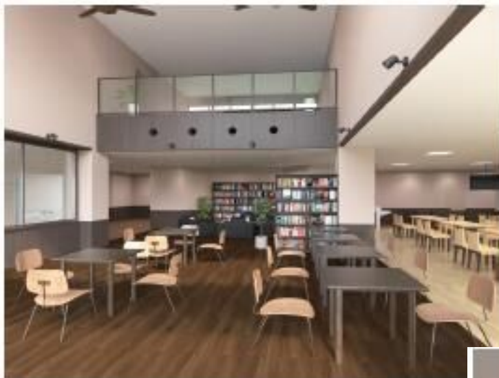
※カフェラウンジスペース

ゆったりとした空間でクオリティの高い食事を提供してくれる食堂。 (食事提供時間制限あり)