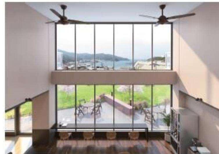
※佐賀関湾を一望できる開放的なデザイン

24時間利用可能な寮員同士の交流や読書を楽しめる上部吹抜の解放感あるカフェラウンジ。