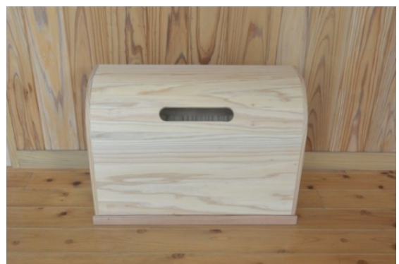
【 木製品 回収箱 】