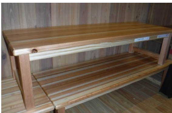
【 木製品 園児用机 】