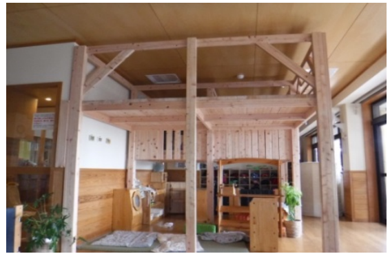
【 木製品 ロフト 】