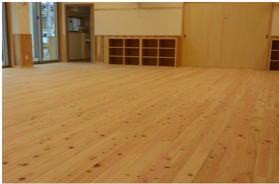
【 木質化 内装フローリング 】