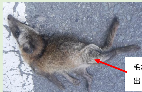
毛が剥がれ皮膚がむき出し状態になっている