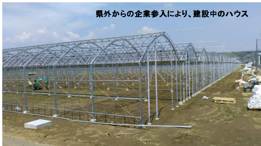
県外からの企業参入により、建設中のハウス